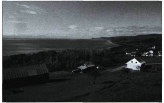
Le village de Saint-Irénée, dans Charlevoix.

Après quelques années d'existence, un des apports intéressants et novateurs de la Réserve de la