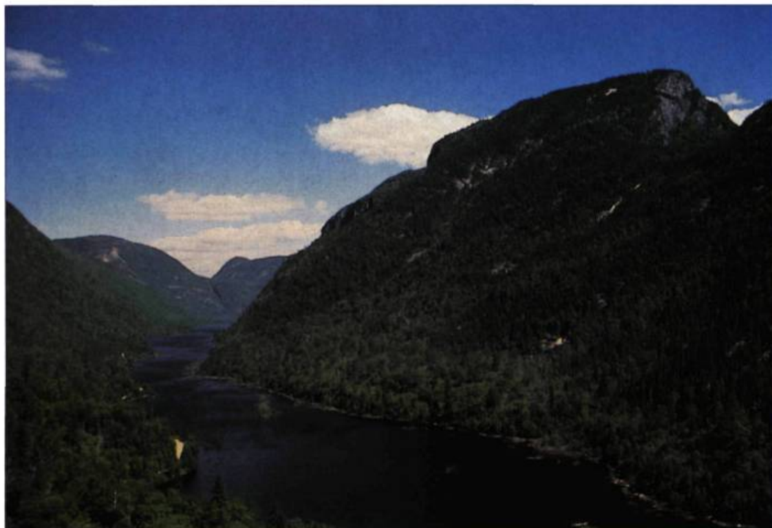
Le parc des Hautes Gorges.