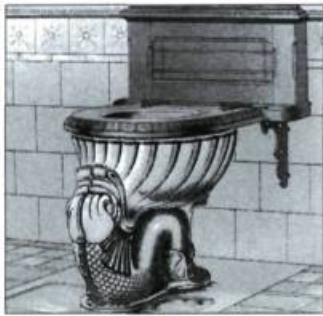
Illustration d'une page de catalogue de la fin du XIX e siècle qui témoigne de l'usage des tuiles dans l'aménagement intérieur de lieux comme la salle de bains où les matériaux doivent être faciles d'entretien et donner une impression de grande propreté.

méthode de la cuenca : à l'aide d'un moule, ils impriment sur les tuiles un motif dont chaque élément est délimité par un pourtour surélevé qui permet d'éviter la fusion des couleurs. Enfin, les Italiens du XV e et XVI e siècles importent une façon de faire développée en Espagne, à l'île de Majorque, et passent maîtres dans la fabrication de la tuile maiolica . La décoration peinte de cette tuile est appliquée sur une glaçure blanche mate contenant de l'oxyde d'étain.