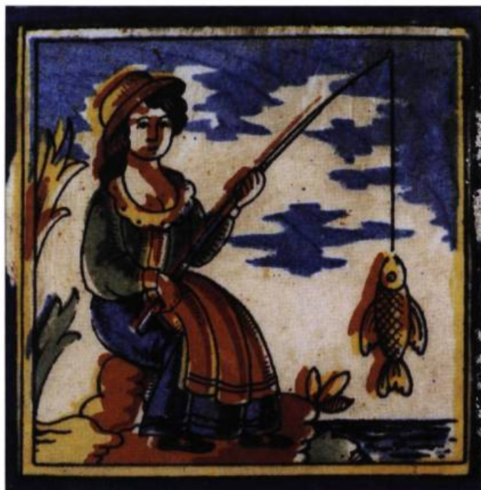
Tuile de faïence espagnole illustrant une scène champêtre typique qui se retrouvait en bandeaux dans les cuisines ou était intégrée ici et là dans un parement de tuiles de couleurs unies.

Utilisée depuis des millénaires, la tuile décorative connaît un regain d'intérêt au XIX e siècle. Ce matériau répond alors aux besoins de beauté et de propreté caractéristiques de ce siècle. La tuile décore alors avec éclat le manteau des cheminées, les planchers et les murs de la salle de bains, de la cuisine, du boudoir ou du vestibule. On retrouve aujourd'hui la chaleur de ce matériau raffiné et résistant. De nombreuses entreprises offrent désormais une grande variété de tuiles qui permettent de créer des décors empreints d'un charme atemporel.