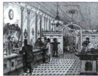
Scène typique à l'intérieur du restaurant Terrapin à Montréal, rue Notre-Dame, vers 1871. L'agencement des tuiles du plancher est caractéristique de l'époque.

Duc, met également en lumière l'utilité et la beauté de ce matériau de construction et de décoration. Le marché, dominé depuis le XVIII e siècle par l'Angleterre et la Hollande, s'étend aux États-Unis vers la fin du siècle alors que plusieurs centaines de compagnies offrent à l'échelle mondiale une variété de motifs et de formes pour répondre aux besoins conceptuels des constructeurs d'édifices. Vers les années 1920-1930, l'avènement de nouveaux matériaux de construction moins coûteux et plus faciles d'installation relègue la tuile à un rôle davantage utilitaire dans les salles de bains et les cuisines.