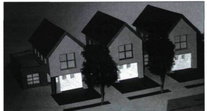
Prototypes de la maison « Nouvelle Aire » qui réinterprètent, 50 ans plus tard, les caractéristiques de la maison de vétérans (concepteurs : Jocelyn Duff et Terrence Dawe).

La maison « Espaces-Vivants » de l'architecte Sevag Pogharian est une maison urbaine qui peut « croître » en quatre étapes selon les besoins et les