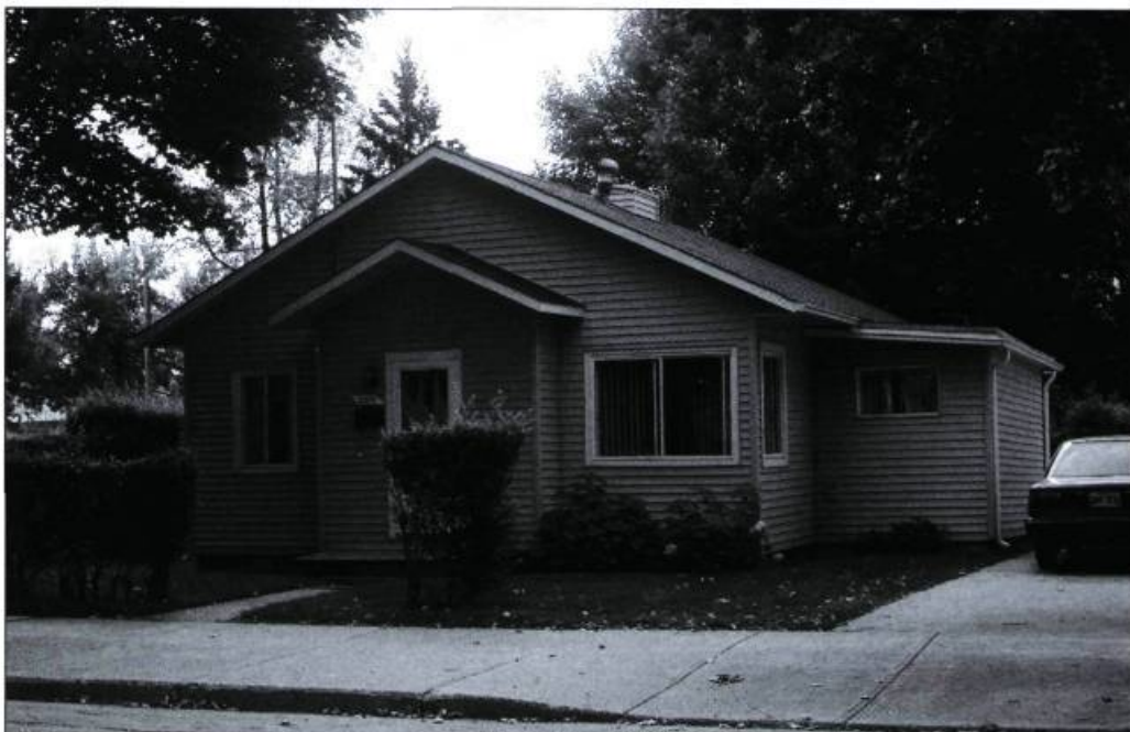
Les maisons de vétérans ont su se transformer et s'adapter aux modes de vie en évolution depuis un demi-siècle (conception : Wartime Housing Limited).

En érigeant il y a 50 ans des maisons de vétérans, on ne faisait pas que régler un urgent problème de logement, on créait un modèle d'habitation dont se réclament encore aujourd'hui des architectes soucieux de bâtir des maisons dotées d'une capacité d'évolution.