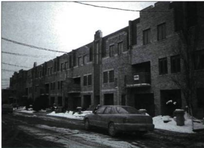
Aujourd'hui, les ensembles d'habitations en copropriété font l'objet de règlements sévères en ce qui concerne les modifications pouvant être apportées aux bâtiments, ce qui a pour effet de figer l'évolution des formes architecturales à l'époque de la construction.

Aujourd'hui, peu de transformations du volume des maisons existantes sont possibles. La réglementation municipale a parfois pour objectif de « protéger » l'image des secteurs résidentiels en interdisant, par exemple, l'ajout d'un étage, d'une rallonge ou même