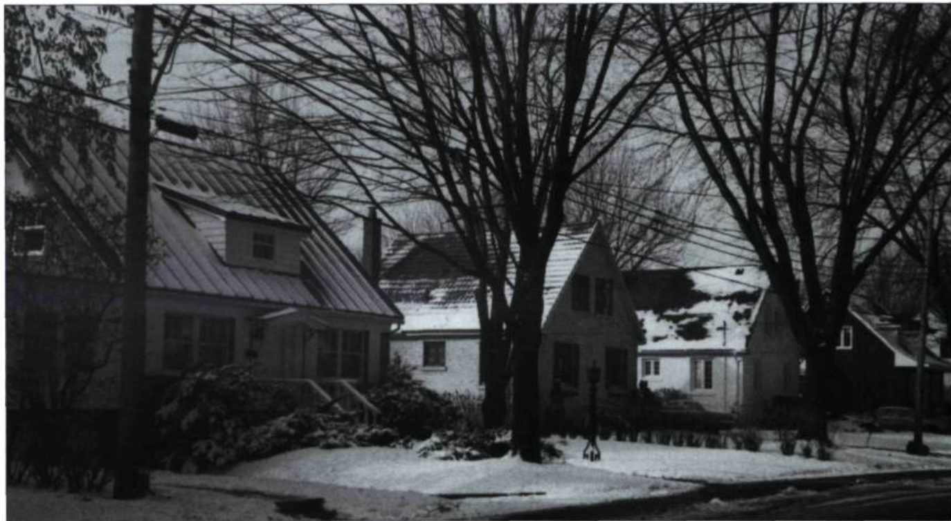
Maisons de la cité-jardin - Arrondissement Rosemont-Petite-Patrie

PAR JEAN-CLAUDE CAYLA, CONSEILLER EN AMÉNAGEMENT