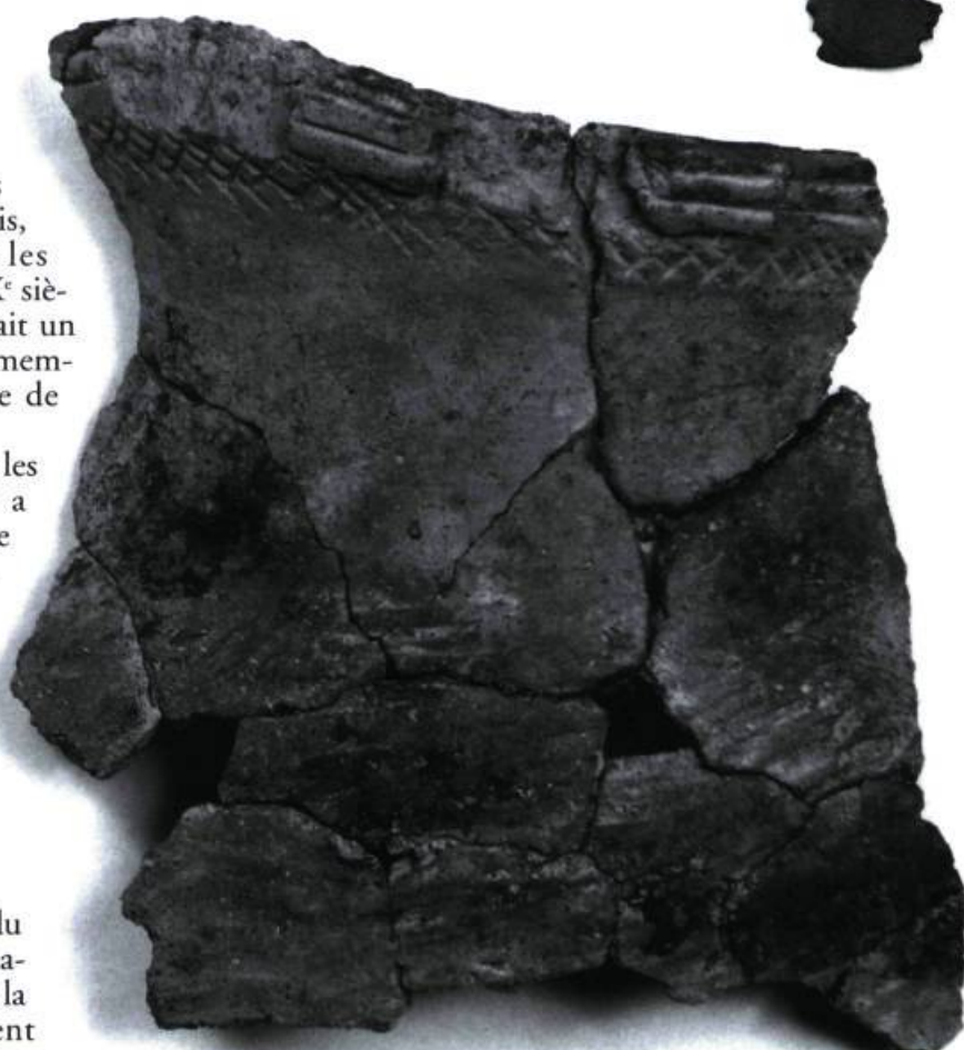
Fragments d'un vase en terre cuite signalant la présence d'habitants de la région des Grands Lacs dans le Parc du lac Leamy au XIV e ou XV e siècle.

Parallèlement à sa vocation agricole, le Parc du lac Leamy a été à l'avant-scène du développement