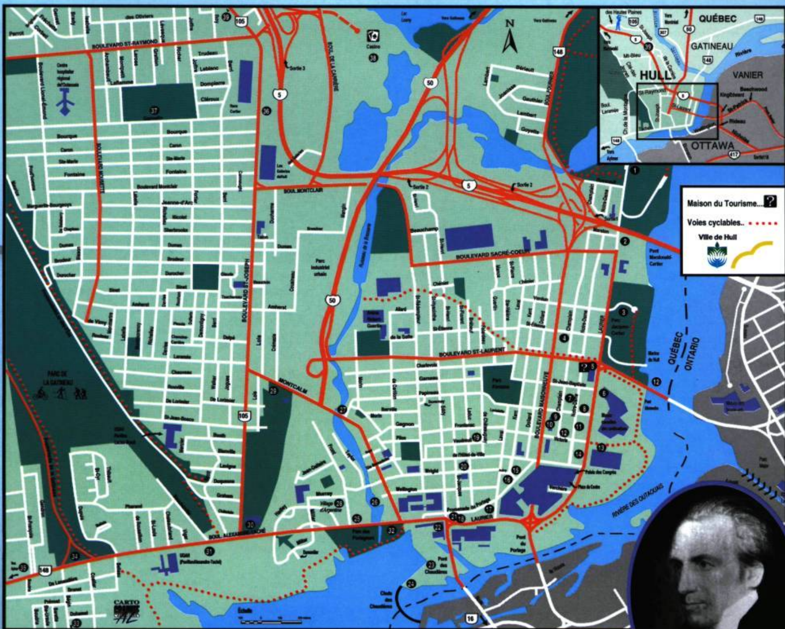
Philemon Wright 1760-1839