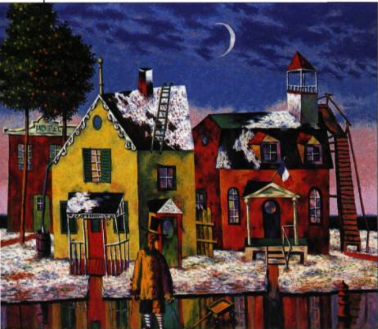
« Cadet Rousselle avait trois maisons », 1954, huile sur toile.