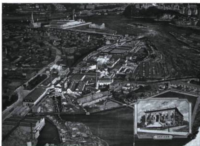
Illustration représentant une vue aérienne de Hull vers 1930.

Le grand Jos Montferrand, tableau de Joseph Saint-Charles, vers 1860.