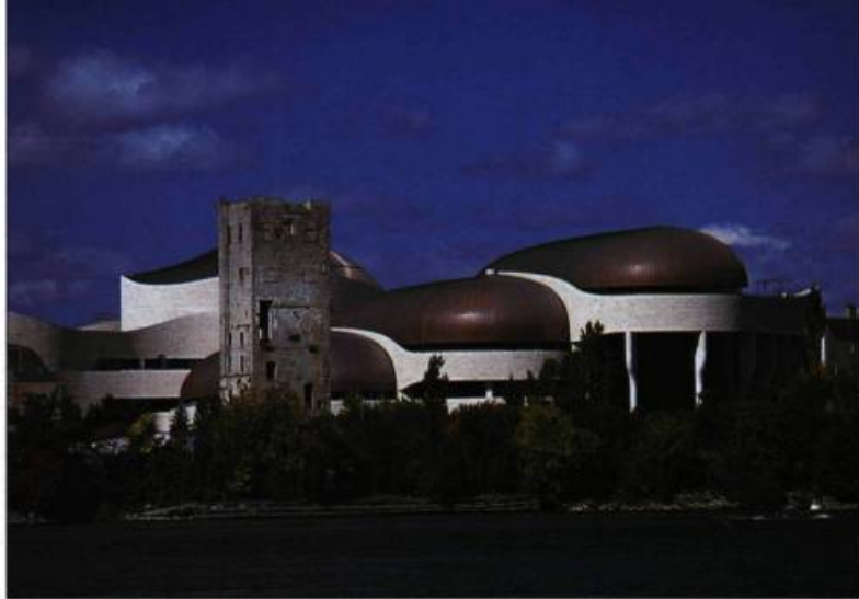
Le Musée canadien des civilisations et la tour du lessiveur.

L'œuvre de Dallaire est très variée et ses tableaux montrent la diversité de ses talents. Poète de l'imagination, il est impossible de le ranger sous la bannière d'une école en particulier. Les musées et les galeries se disputent aujourd'hui à prix d'or les tableaux de cet artiste fécond. La Ville de Hull possède plusieurs de ses œuvres que les amateurs d'art peuvent admirer à la maison du Citoyen.