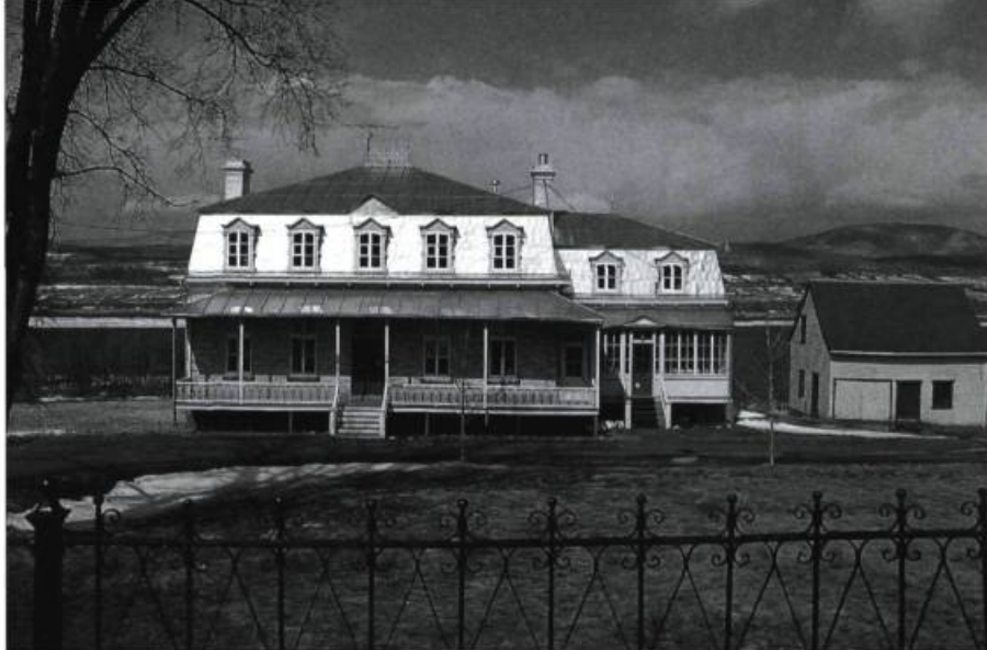
Presbytère de Sainte-Famille, David Ouellet, 1888. La villégiature et les résidences sacerdotales vont pousser la mode éclectique dans l'île. Beau spécimen de maison à toit mansard.

Enfin, l'architecture « moderne » est apparue. La maison minimaliste éminemment fonctionnelle, une boîte carrée, demeure le plus digne représentant du renouvellement et de la simplification de l'habitat humain à l'île. On en trouve un certain nombre de spécimens, quelques-uns offrant une façade écran qui dissimule la hauteur véritable des carrés. Après la Seconde Guerre mondiale, les berges du versant sud sont massivement envahies par des estivants qui érigent des chalets saisonniers eux aussi fonctionnels et élémentaires. Ce mur de mer, qui empêche le grand public et les résidents d'avoir accès au fleuve, est petit à petit hivernisé. Après le décret de 1970 faisant de l'île un arrondissement historique et à la suite de la mise en vigueur d'un certain contrôle architectural, la maison inspirée des modèles traditionnels va se multiplier dans de nouveaux développements ou pimenter des alignements centenaires. L'architecture domestique de l'île d'Orléans traduit le goût des habitants pour des manières d'habiter un espace en fonction d'une culture. On peut ainsi lire dans le paysage insulaire l'influence