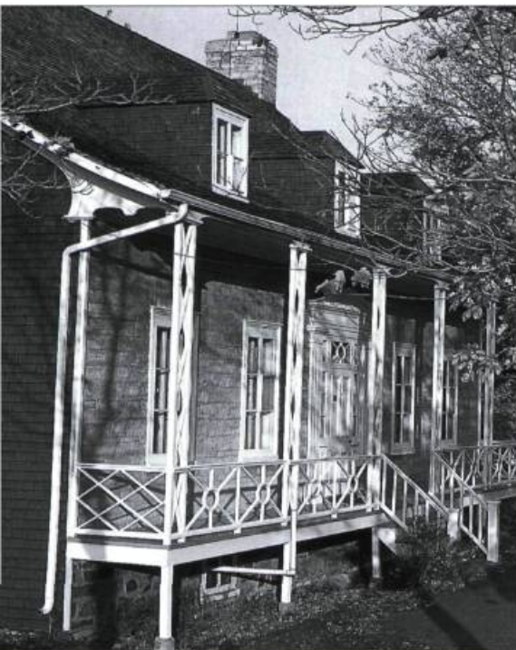
Presbytère de Saint-François, 1867. Dans le modèle vernaculaire québécois, l'expression classique apparaît entre autres dans la symétrie des éléments, dans le profil « à la chinoise » des pignons et dans les éléments décoratifs du portail et des intérieurs.

jusqu'à la Défaite de 1760 s'inspireront largement de la façon de se loger en sol français, s'en référant à du connu. Bien sûr, des ajustements mineurs se révéleront vite nécessaires pour tenir compte des spécificités du milieu. À leur arrivée, les troupes anglaises voudront faire table rase et tout détruire. Un très grand nombre de maisons seront ainsi brûlées. La paix venue, la reconstruction se fera encore une fois à partir de modèles connus, expérimentés depuis 75 ans. Plusieurs rebâtiront en reprenant le périmètre de pierre resté debout. Et jusqu'en 1820, ou à peu près, c'est ce genre qui donnera le ton.