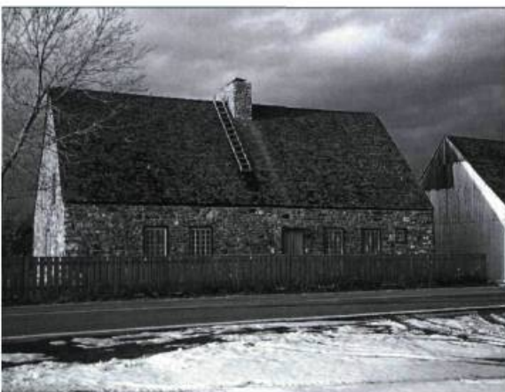
Les maisons d'« esprit français » sont encore nombreuses dans les six paroisses de l'île. Ces constructions se caractérisent, entre autres, par un toit aigu et par l'absence de rive et de larmiers.