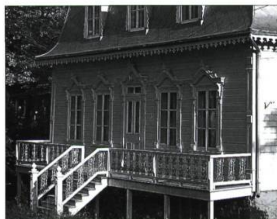
Des fioritures en bois ou en fonte complètent l'agrément des maisons de type éclectique.