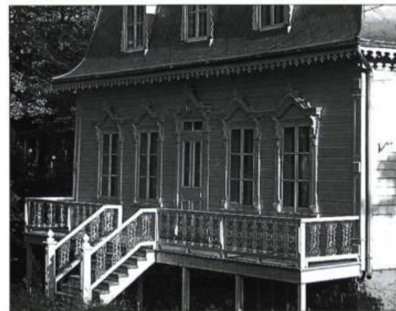
Des fioritures en bois ou en fonte complètent l'agrément des maisons de type éclectique.