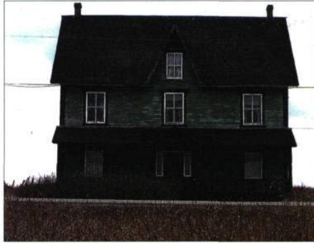
Percé : secteur de Pointe Saint-Pierre. Maison de style victorien construite vers 1870 par un propriétaire de commerce de la pêche à la morue.

Belle-Anse, Barachois, Pointe-au-Cap, Malbaie, autant de secteurs du Percé d'aujourd'hui où l'architecture témoigne encore du dynamisme de la pêche à la morue au début du XX e siècle. À Saint-Georges-de-la-Malbaie comme à Pointe-Saint-Pierre, de belles résidences de style néogothique, ornées de frises d'influence victorienne et de balustrades de ferronnerie, attestent du rang social du propriétaire pendant que la précarité du statut d'engagé se lit dans le modeste perron de l'habitation du pêcheur des environs.