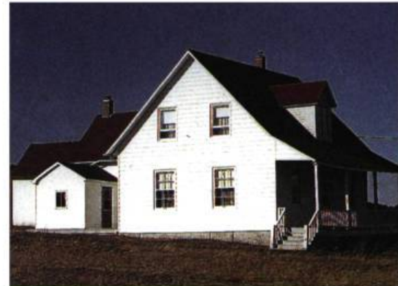
Percé : secteur de l'Anse-à-Beaufils Excellent état de conservation d'un bel exemple d'une adaptation élégante de l'architecture traditionnelle régionale.

Jean-Louis Le breux est directeur du Chafaud-Musée.