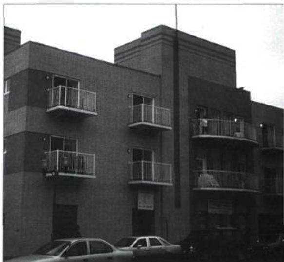
Cet ancien édifice à bureaux, vacant à plus de 80 % pendant plusieurs années, a subi des transformations majeures. C'est aujourd'hui un édifice à logements pour retraités.

Le sauvetage du centre-ville de Chicoutimi nous a appris que si on laisse se dévitaliser un arrondissement commercial, ses fonctions industrielle et résidentielle suivront peu à peu, transformant le quartier en zone urbaine à la dérive. À Chicoutimi, nous avons réussi à stopper ce dépérissement grâce à d'intenses efforts et à l'appui d'une communauté dynamique qui a concocté une stratégie de réappropriation du territoire axée sur de nouvelles vocations urbaines.