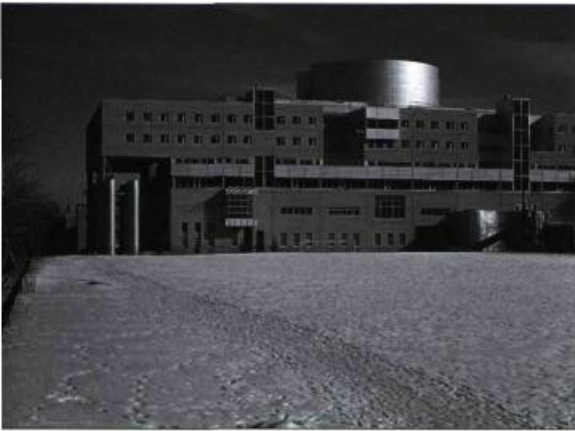
La nouvelle École des Hautes Études Commerciales (1995). Conception Dan Hanganu, architecte.

la qualité de la vie qu'il permet sont des critères essentiels que ne doivent pas masquer les faux problèmes de conservation engendrés par la crainte du changement ou le manque d'imagination – notre pire déficit national, selon l'écologiste Pierre Dansereau.