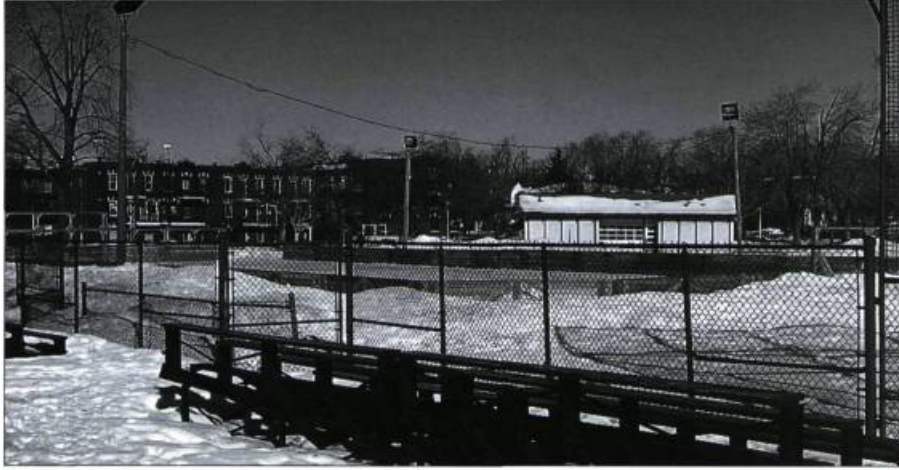
Le parc Jean-Brillant.