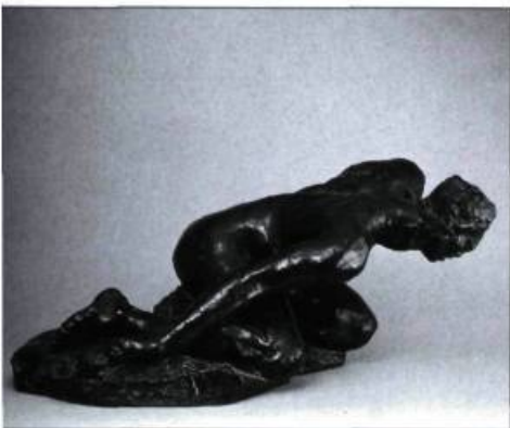
Auguste Rodin La Muse tragique, vers 1895