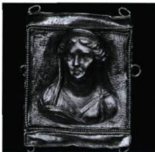
Plaque en or ornée d'un buste de femme. Grèce, 2 e /1 er siècle av. J.-C.

L'exposition « L'or de la Méditerranée » présente toute la mythologie antique façonnée sur les pièces d'une collection exceptionnelle de bijoux anciens datée du 7 e siècle av. J.-C. jusqu'au 3 e siècle de notre ère. Jusqu'au 2 août. Information: (514) 285-1600.