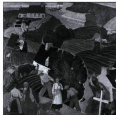
Maurice Raymond, Poème de la terre, 1940. Coll. Musée du Québec.

Reprenant le titre d'une œuvre de Maurice Raymond réalisée en 1940, l'exposition « Poème de la terre » rend hommage à un art qui se fait l'écho d'une période de transition dans l'histoire du Québec: l'influence de la société agricole traditionnelle du début du XX e siècle dans la production picturale. Cette exposition itinérante, préparée par le Musée du Québec, présente une trentaine d'œuvres signées Walker, Fortin, Gagnon et Leduc, entre autres. Présentée jusqu'au 18 octobre. Trois-Rivières. Information: (819) 372-0406.