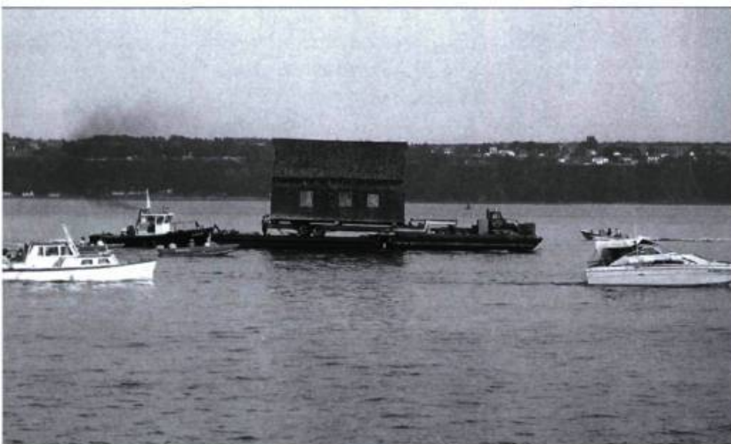
Construite en 1837 et classée monument historique en 1977, la chalouperie Godbout est déplacée par voie d'eau en 1989 vers l'ancien chantier maritime de Saint-Laurent, à l'île d'Orléans.