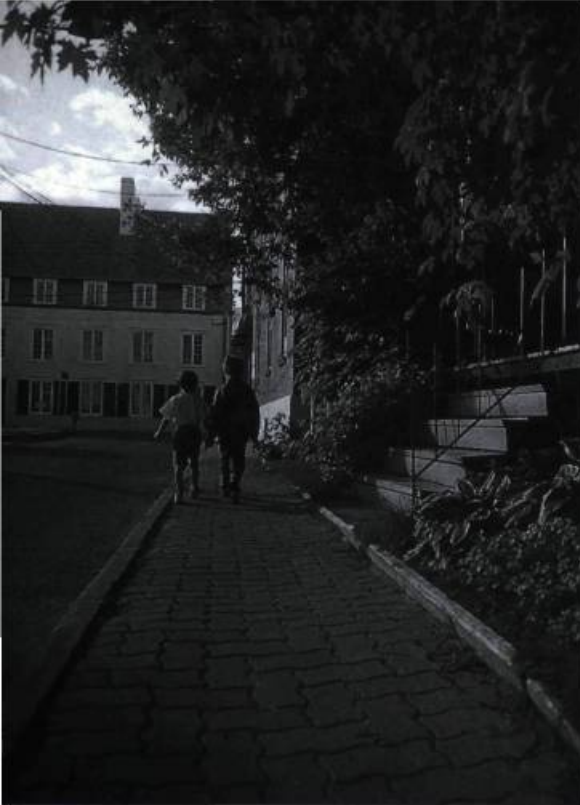
De la rue Saint-Louis, dans le Vieux-Trois-Rivières, le manoir de Tonnancour, qui abrite aujourd'hui la Galerie d'art du Parc.