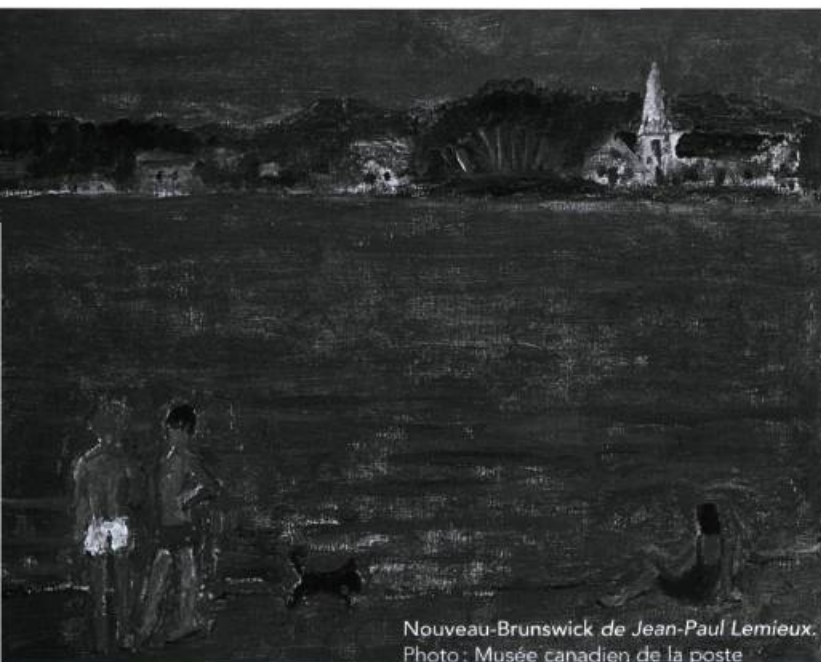
Nouveau-Brunswick de Jean-Paul Lemieux.

Jusqu'au 22 mars 1999, l'exposition « Jean-Paul Lemieux, Visions du Canada » est présentée au Musée canadien de la poste, qui loge au Musée canadien des civilisations. Douze tableaux de petits formats, commandés à l'artiste en 1984 dans l'optique de les reproduire sur des timbres-poste, font l'objet de cette