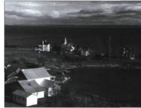
Le village de Port-au-Persil.

Les 16 et 17 octobre prochain, à Saint-Irénée dans Charlevoix, les États généraux du paysage québécois, en collaboration avec le Centre d'études collégiales en Charlevoix et le Glynwood Center de New York, tiendront pour la première fois un colloque réunissant des experts internationaux. Au centre des discussions: le tourisme et les paysages au Québec (le développement en milieu rural et la problématique du développement touristique et de la protection des paysages charlevoisiens) et l'expérience étrangère (France, Angleterre, États-Unis). Information: (418) 692-2607, http://www.paysage.qc.ca