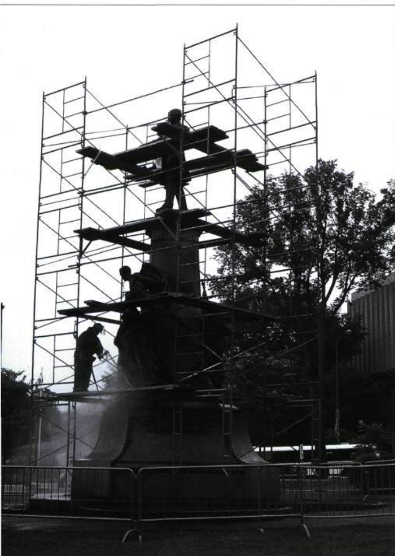
La restauration en 1997 du monument dédié à Honoré Mercier, œuvre de Paul Chevré, datant de 1911.

Contre les processus de corrosion déjà enclenchés exige d'abord que l'on élimine complètement les produits corrosifs actifs, plus particulièrement les chlorures, et que l'on transforme chimiquement certains autres, tels les sulfates. Cela signifie aussi qu'il faudra protéger la surface métallique en appliquant un inhibiteur de corrosion (le benzotriazole). Ce produit jouera un rôle d'imperméable chimique, de bouclier dressé contre les polluants atmosphériques, alors que des enduits comme le vernis et la