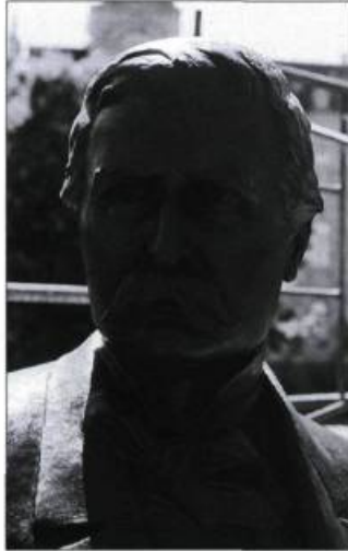
La patine verdâtre des monuments de bronze est l'effet des produits de corrosion. Le plus souvent, elle nuit à la lisibilité de l'œuvre. Ici on peut voir le monument Honoré Mercier, avant et après sa restauration.