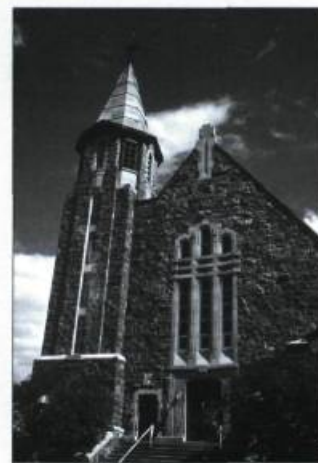
L'église de Sainte-Amélie.