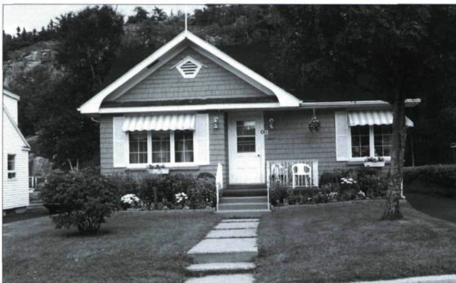
Une des petites maisons de la rue Laval.

Un tel objectif ne peut être atteint sans la collaboration des résidents. La municipalité doit par conséquent élaborer de vrais outils de gestion, tel un plan d'implantation et d'intégration architectu-