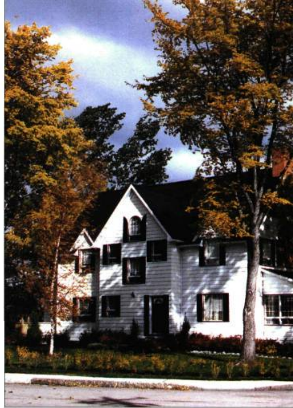
Avec les années, une forêt urbaine s'est développée dans le quartier Sainte-Amélie.

de son passé industriel. Ce patrimoine méconnu, particulièrement important dans le quartier Sainte-Amélie, représente un potentiel touristique énorme qui attend impatiemment d'être sauvé et exploité.