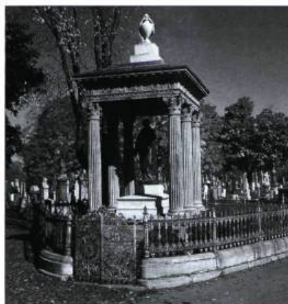
Monument de la famille Venner au cimetière Saint-Charles, à Québec.