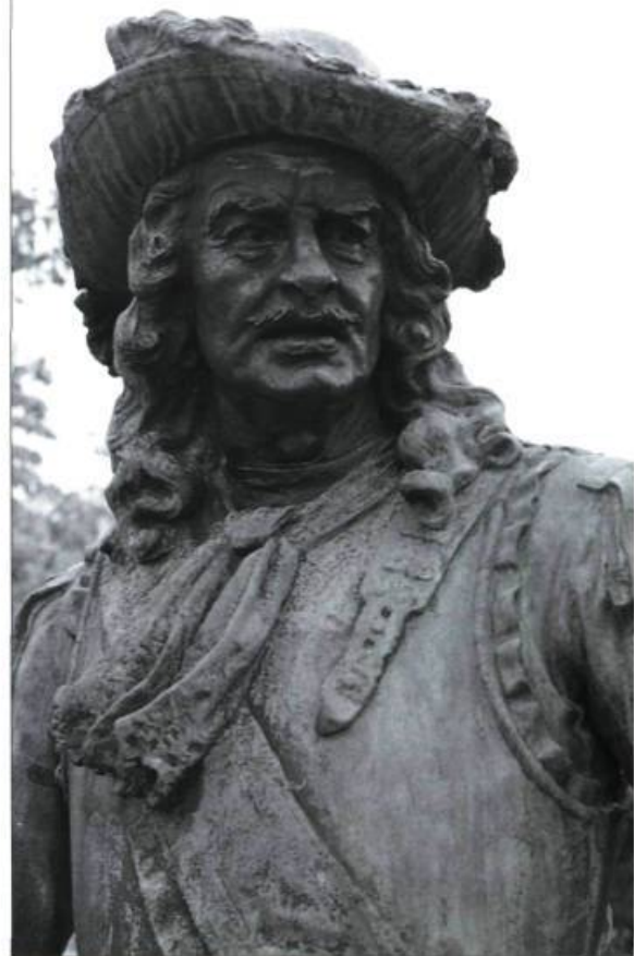
Le monument en hommage à Frontenac, une œuvre de Louis-Philippe Hébert, est l'un des 22 bronzes qui ornent la façade du Parlement de Québec.

Au début des années 1980, les différentes administrations gouvernementales, les villes de Montréal et de Québec mesureraient l'importance de sauvegarder le patrimoine sculpté. D'autres organismes ont aussi voulu poursuivre une certaine tradition commémorative en l'actualisant. La Commission de la capitale nationale, notamment, inaugurait récemment la statue de René Lévesque. Les grands musées québécois ne sont pas en reste