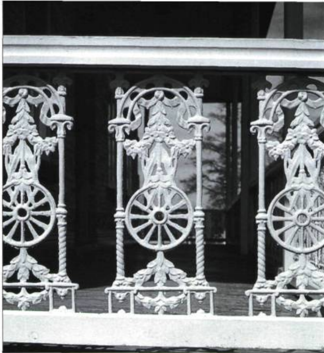
Balustre de garde-corps en fonte présentant un motif géométrique et différents motifs floraux.

Les éléments de fer forgé composés de sections carrées ou rectangulaires sont souvent assemblés à la manière des assemblages de charpente de bois ; ils peuvent aussi être soudés au fer, assemblés au rivet ou au collier. Les éléments de fonte plus épais s'assemblent à l'aide de boulons et d'écrous. Rappelons