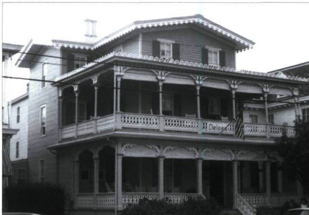
Bel exemple de balcon-galerie dans la ville de Cape May, aux États-Unis.

du bas. D'une esthétique moins intéressante que la méthode traditionnelle, cette façon de faire présente aussi un inconvénient majeur. Les extrémités des balustres non protégées sous la main courante restent exposées aux intempéries. Elles risquent donc de pourrir plus rapidement.