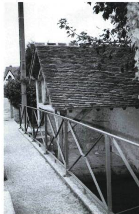
À Buxières-sous-les-Côtes, dans le Parc régional de Lorraine, la restauration d'un ancien lavoir a amené la définition d'une nouvelle fonction. Devenu halte pour les randonneurs, ce témoin du patrimoine lié à l'eau sert également à la mise en valeur d'un patrimoine fruitier puisqu'il intègre maintenant un alambic communal pour la mirabelle.

Pour le ministère de l'Agriculture, la Loi d'orientation des milieux agricoles de 1999 a instauré un principe de