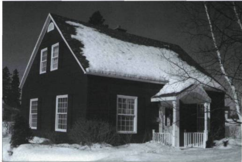
Le SARP conseille les propriétaires qui rénovent leur maison au sujet du choix des matériaux.