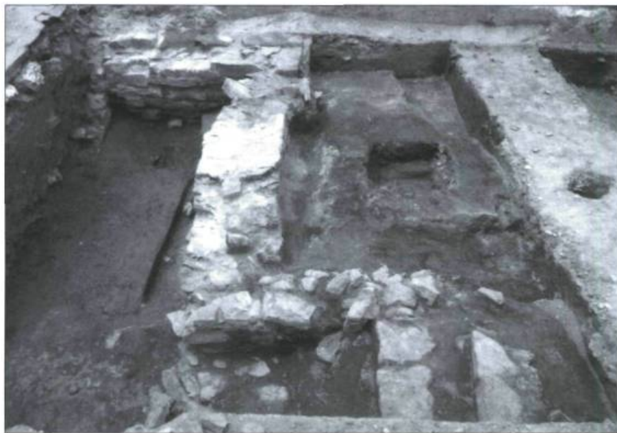
L'angle nord-est des fondations de la maison. L'escalier de la cave se trouve au premier plan.