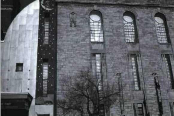
Le Musée Juste pour rire dans l'ancienne brasserie Ekers.