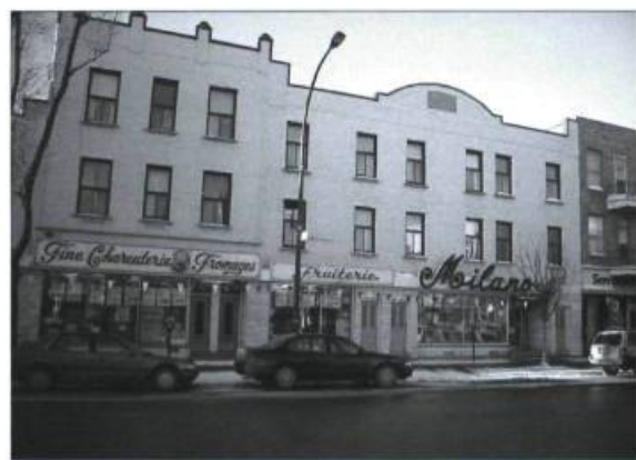
La Fruiterie Milano