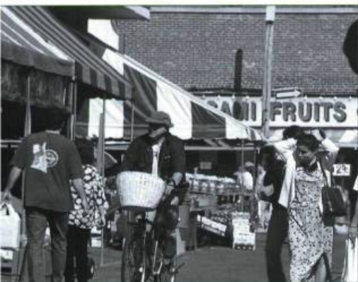
Le Marché Jean-Talon