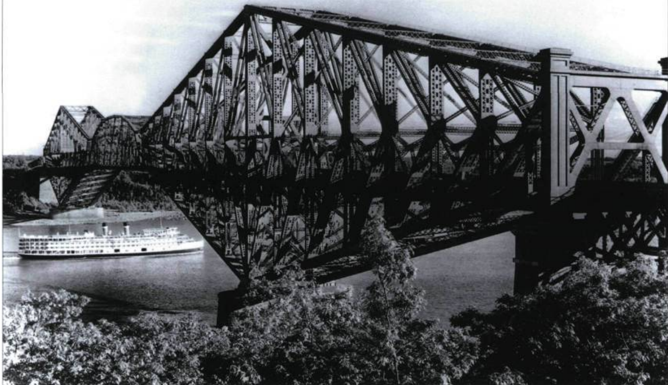
Les célèbres «bateaux blancs» de la Canada Steamship Lines ont fait les belles heures des croisières sur le Saint-Laurent au XX e siècle.