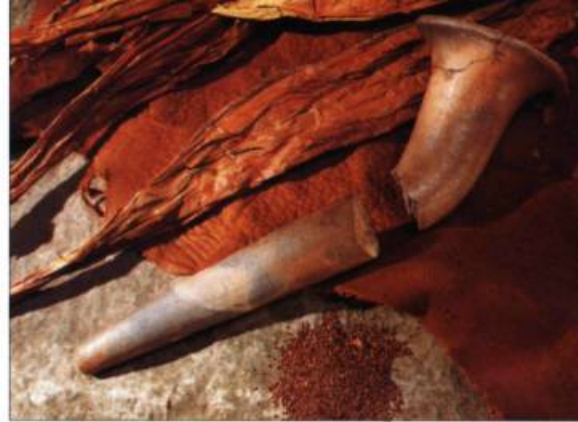
Les pipes en argile et le tabac retrouvés sur le site Droulers témoignent de l'importance de fumer pour les Iroquoiens. Une action qui revêtait un caractère religieux.