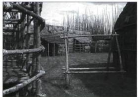
Les maisons longues étaient l'habitation type de ces groupes d'Amérindiens. Généralement, les villages étaient ceinturés d'une palissade qui protégeait des envahisseurs et des intempéries.