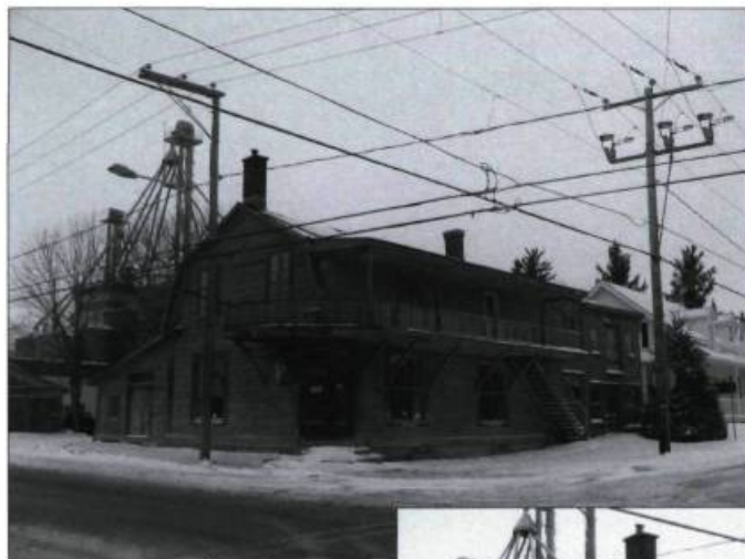
Le magasin général d'Upton au début du siècle et maintenant après restauration.