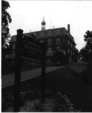
Un trottoir d'ardoise rappelle l'ancien trottoir de bois. Il fait le lien entre la Maison de la paroisse et l'église.

L'aménagement et l'interprétation de ce lieu de mémoire ont été récemment complétés (voir Continuité , n° 97, été 2003, p. 29). Le site historique, le circuit d'interprétation et la Maison de la paroisse s'affichent désormais avec élégance dans la rue principale du village. La signature renouvelée de cet ensemble fait valoir de nouveaux aménagements et un circuit d'interprétation. Le paysage urbain a bénéficié de l'enfouissement des fils aériens.