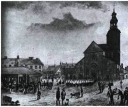
« Le Marché de la Haute-Ville » tel que saisi par J.P. Cockburn en 1829.