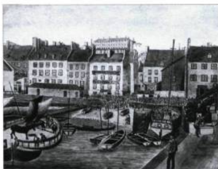
« La place du Marché de la Basse-Ville vue du Quai McCallum, 1829 » (place du marché d'en bas).

Dès 1640, entre le magasin du Roi et celui des Cent associés se trouve le premier marché de la Basse-Ville. Il s'agit alors d'un espace en plein air où se rencontrent les paysans des environs et les habitants de la ville. Des étals de bou-