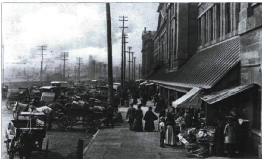
396 QUÉBEC. — Champlain Market QUÉBEC. — Le Marché Champlain.

Très jolie carte dans les tons sépia. Montréal comptait aussi d'autres marchés comme celui de la place Jacques-Cartier. En été, les étals regorgeaient de produits frais amenés de la campagne environnante. Les cartes postales de cette époque étaient très souvent éditées par des entreprises anglophones, ce qui explique les textes en anglais.