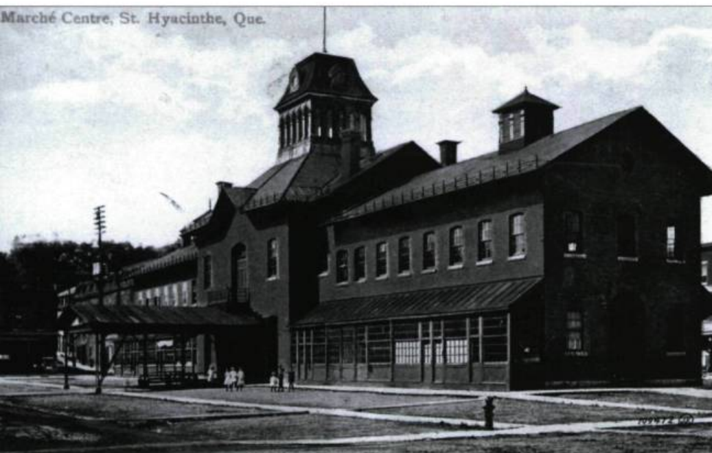
Marché Centre, St. Hyacinthe, Que.

Le marché, qui sera livré en juin 1877, est construit sur les anciennes fondations allongées de quelques mètres. Plus haut que le précédent, il comprend une partie centrale chapeautée d'une tourelle de sept mètres et demi, enjolivée de lucarnes et de fenêtres cintrées inspirées du style victorien. La tour comporte un balcon de part et d'autre. Pendant les campagnes électorales, les candidats y prononcent des discours que la foule vient entendre en se déplaçant d'un côté à l'autre. Le second