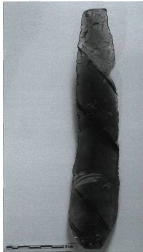
L'analyse de tracéologie, qui met à profit les percées technologiques, sert à diagnostiquer la fonction des outils en pierre préhistorique par l'observation, au microscope métallographique, des traces d'usure présentes. Dans ce cas-ci, les traces de l'objet grossi 100 fois permettent de comprendre que la lame était un élément de faucille et servait à moissonner. Cet outil de pierre préhistorique en obsidienne (4000 av. J.-C.) provient du site d'Aratashen, en Arménie.

Par ailleurs, les avancées dues aux technologies électroniques sont là pour rester, car elles permettent un changement notoire de paradigme – et de fonctionnement et de philosophie. On n'a qu'à penser aux possibilités infinies de la numérisation, qui permet une modélisation extrêmement performante et fort utile dans nos recherches en culture matérielle. Toutes les dimensions d'un objet, d'un édifice, d'un monument ou d'une œuvre d'art peuvent maintenant nous être révélées dans leur complexité. On ne peut faire l'économie de cet avantage pour des raisons strictes de connaissances et de savoir. Il en va de même pour les projets liés à la réalité augmentée où, encore là, les technologies de projection numérique permettent de recomposer les éléments disparus d'un objet du passé. À l'aide d'une sorte d'orthèse visuelle, on vient combler les vides, les parties manquantes d'un artefact, grand ou petit. Les possibilités demeurent donc pour l'instant illimitées