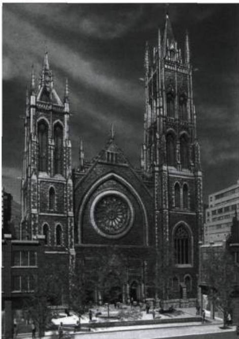
Esquisse du nouveau parvis de l'église unie St. James.

Ill. : Groupe Cardinal Hardy, aménagement et design urbain