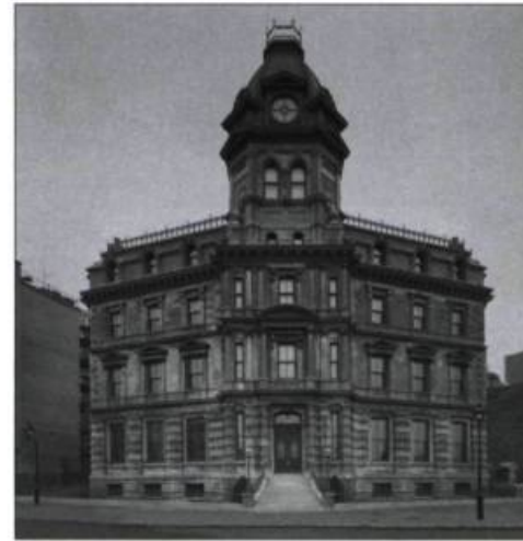
L'ancien édifice des Commissaires du Port de Montréal restauré.