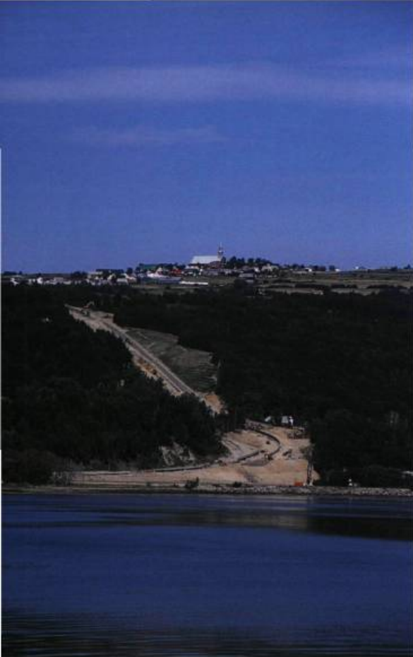
La nouvelle côte des Éboulements : une transformation majeure du territoire charlevoisien qui a suscité tollés et éveil des consciences.