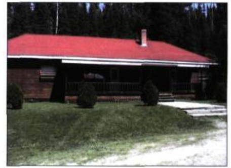
Le pavillon Au 23 miles est situé sur la rivière Patapédia, dans l'arrière-pays du village de L'Ascension-de-Patapédia. Son mode de construction s'inspire de l'architecture de la colonisation.

Durant près de 60 ans, ces revendications restent sans réponse. Après que le site Matamajaw eut changé plusieurs fois de mains, le gouvernement du Québec l'achète en 1974. Dix ans plus tard, le ministère des Affaires culturelles le classe bien culturel, puis, en 2001, le ministère de la Culture et des Communications le reconnaît comme institution muséale. Les valeurs historique et ethnologique de ce site sont finalement reconnues à leur juste valeur, ce qui lui vaut d'être soutenu financièrement par les gouvernements.