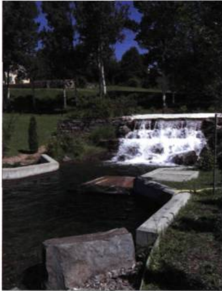
La fosse aux saumons sur le site de la Matamajaw permet d'observer les saumons dans un habitat naturel.