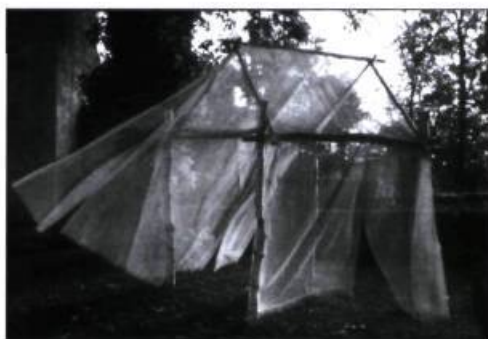
La carrée du sourcier.