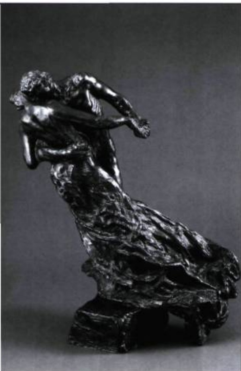
La Valse de Camille Claudel, bronze, 43,2 x 23 x 34,3 cm, 1893, coll. Musée Rodin, Paris.