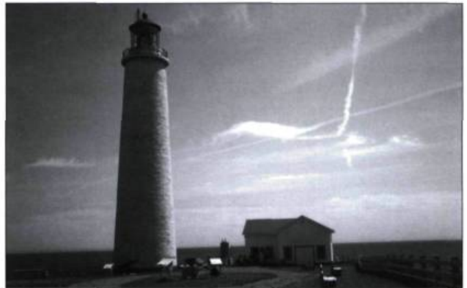
Le phare de Cap-des-Rosiers en Gaspésie.

Information : (418) 724-6214 ou www.routedesphares.qc.ca