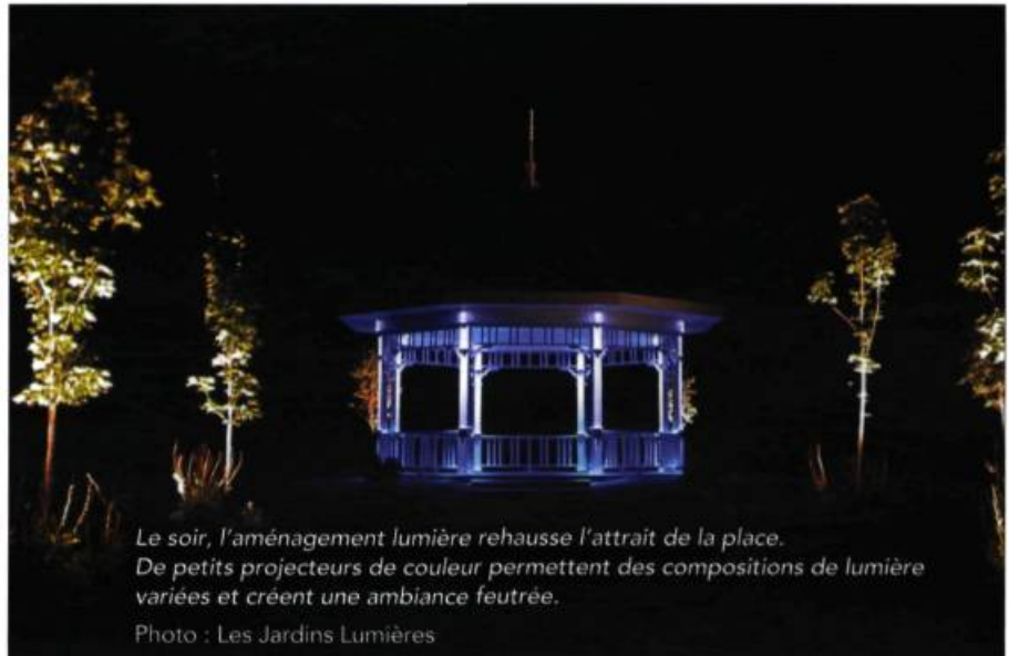
Le soir, l'aménagement lumière rehausse l'attrait de la place. De petits projecteurs de couleur permettent des compositions de lumière variées et créent une ambiance feutrée.

Durant la réalisation de la place publique, les membres du comité consultatif d'urbanisme se sont bien sûr penchés sur sa désignation. Le nom qu'ils ont retenu honore celui qui a marqué l'histoire de ce coin de pays au milieu du XIX e siècle : Jean-Baptiste-Éric Dorion, fondateur de L'Avenir (voir l'encadré). Le 18 juin 2005, lors de l'inauguration de la place