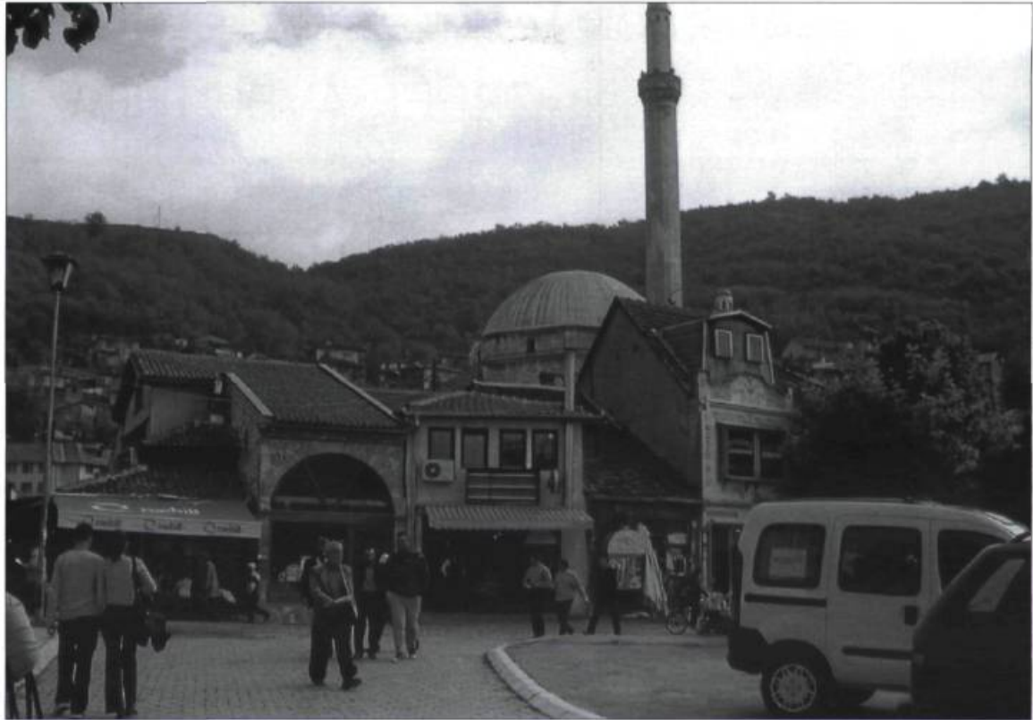
La localité de Prizren, qui compte aujourd'hui quelque 124 000 habitants, a été fondée il y a près de 1000 ans.

Aujourd'hui espace de calme, de paix et d'agrément, lieu d'une beauté retrouvée, la place publique de Prizren est