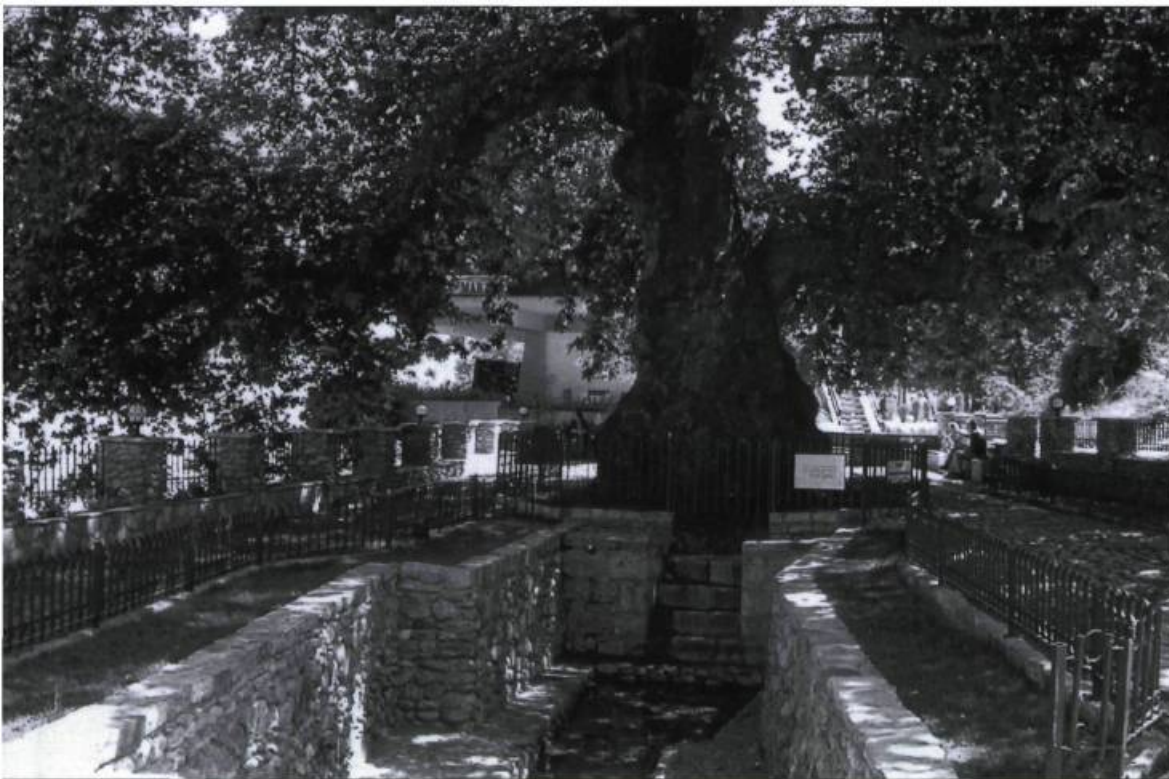
Le parc revitalisé grâce aux bons soins de la Fondation patrimoine historique international (Canada), au cœur duquel trône un superbe platane vieux de 400 ans.

international (Canada) a parcouru un territoire ravagé par l'entêtement meurtrier des hommes. L'image d'une église orthodoxe prisonnière derrière trois rangs de fils de fer barbelés suffit à comprendre la situation. Dans la nef de cette église, des fresques datant du XV e siècle portent comme