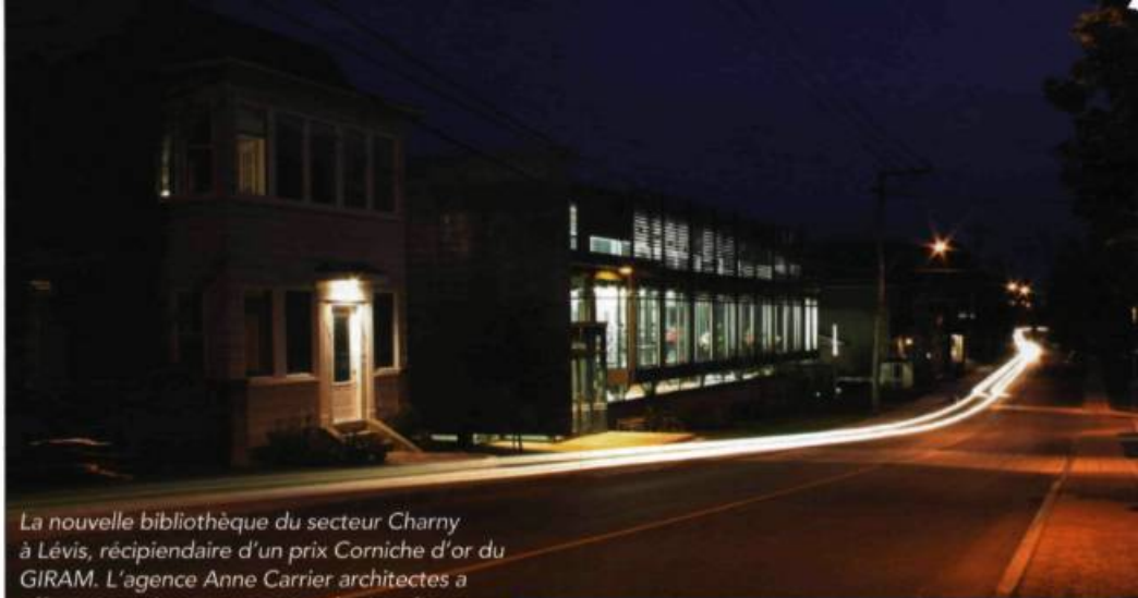
La nouvelle bibliothèque du secteur Charny à Lévis, récipiendaire d'un prix Corniche d'or du GIRAM. L'agence Anne Carrier architectes a effectué une lecture attentive du site afin que ce bâtiment contemporain s'insère bien dans le vieux centre de Charny.

Or, si cette approche a permis de maintenir le charme des vieux quartiers, elle s'accompagne d'effets secondaires importants. D'une part, en raison des adaptations cumulatives des modèles traditionnels aux