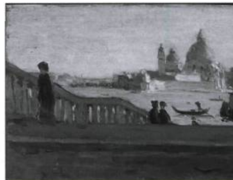
La Salute vue du Ponte della Paglia, Venise, de Clarence Gagnon, huile sur panneau de bois, 15,8 x 23 cm, 1905.

« Clarence Gagnon, 1881-1942. Rêver le paysage » est la première rétrospective consacrée à cet artiste québécois depuis l'exposition ayant souligné son décès en 1942. Le parcours de l'artiste est retracé à travers 150 œuvres, majoritairement des peintures, mais aussi des gravures et des croquis. Le visiteur passe de ses premières réalisations, qui s'inscrivent dans la lignée du mouvement de renouveau de l'estampe originale au Canada et qui l'ont fait connaître en Europe, à ses illustrations lui ayant valu une réputation internationale, notamment celles des romans Grand Silence blanc , de Frédéric Rouquette (1928), et Maria Chapdelaine , de Louis Hémon (1933), sans oublier ses célèbres paysages de Charlevoix. Jusqu'au 10 septembre, au Musée national