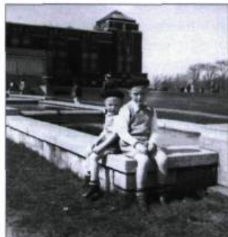
L'exposition « Souvenirs de famille du Jardin botanique » regroupe des photos que des visiteurs ont prises.

Information : (514) 872-1400 ou www.ville.montreal.qc.ca/jardin