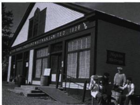
Le Magasin général historique authentique de L'Anse-à-Beaufils.