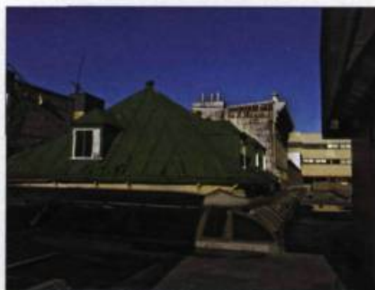
Sur le toit du Mail...