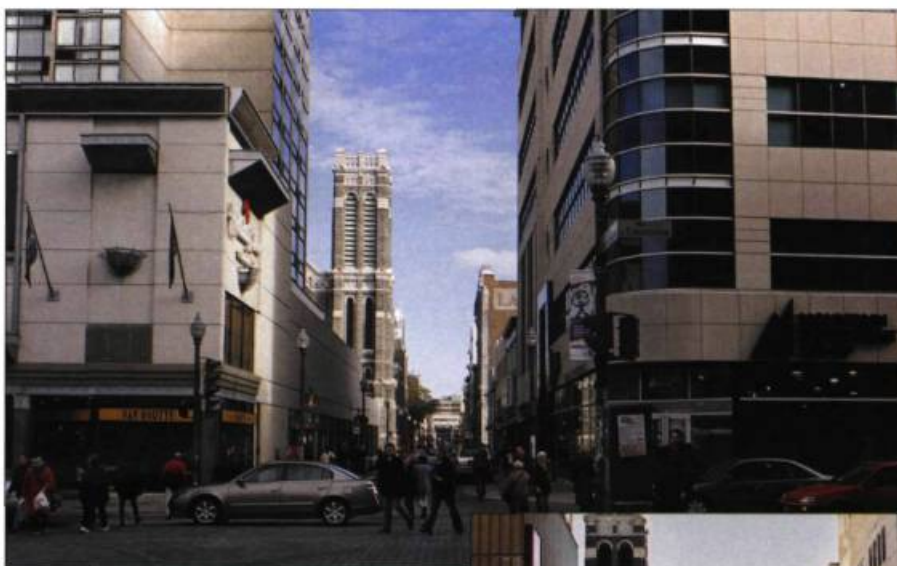
L'angle de la Couronne et Saint-Joseph, après et avant l'enlèvement du fameux toit.

Le succès de la revitalisation de Saint-Roch et de la rue Saint-Joseph tient à plusieurs facteurs. Il dépend d'interventions publiques et de fonds privés, d'un suivi assidu par l'administration municipale et d'un dialogue constant avec les citoyens et