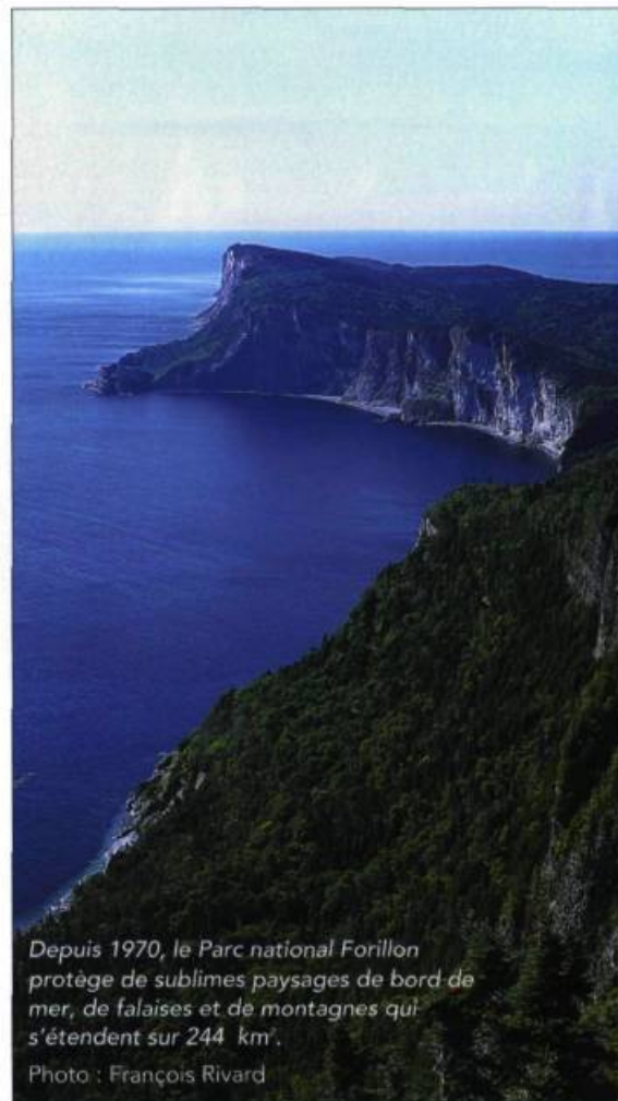
Depuis 1970, le Parc national Forillon protège de sublimes paysages de bord de mer, de falaises et de montagnes qui s'étendent sur 244 km 2 .

Lise Deguire-Maloney, qui était mariée au propriétaire de l'Auberge de l'île Bonaventure, se rappelle avec désolation la destruction du patrimoine qui a suivi l'expropriation de 1974. « Il y avait des maisons côte à côte sur l'île. Ils les ont laissées pourrir sur place », reproche-t-elle. L'auberge qui bordait l'île a été brûlée, comme beaucoup d'autres maisons et chalets parfois en très bon état. « Elle était très belle, campagnarde, confortable, style bed and breakfast . Elle s'inscrivait dans l'esprit des auberges d'Irlande et d'Angleterre. Je suis allée sur l'île la première année de l'expropriation, mais je ne suis pas capable d'y retourner », raconte avec tristesse M me Deguire-Maloney,