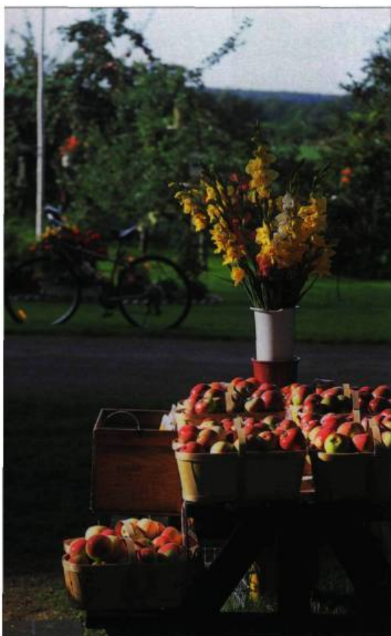
Les itinéraires touristiques s'écartent parfois du trajet historique.