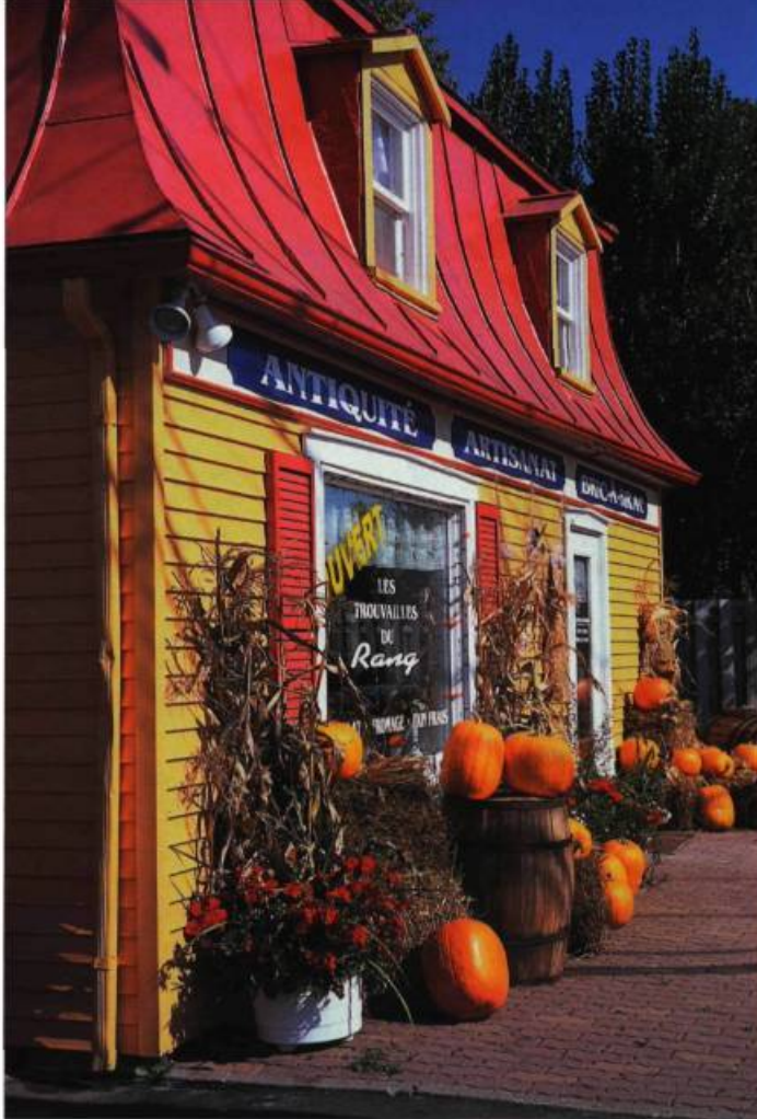
Magasin aux couleurs automnales dans le village de Saint-Augustin-de-Desmaures.