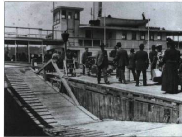
À Saint-Romuald, le quai du Bateau est le centre des affaires où les habitants viennent vendre leurs produits.