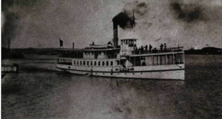
Ce traversier à vapeur de la Compagnie maritime et industrielle de Lévis est vendu vers la fin des années 1920, après une baisse du commerce interrives. Utilisé dans le cabotage, il fait naufrage au large de Cuba en 1948.