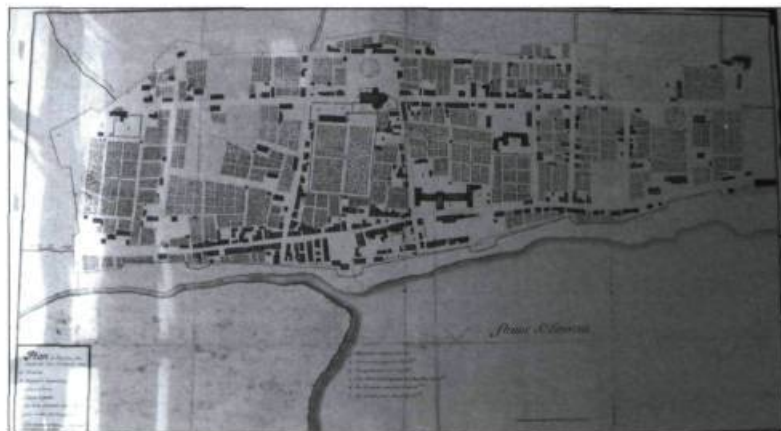
Plan de la ville de Montréal relevé en 1704 par Jacques Levasseur de Néré.

mur, une pratique courante à l'époque. D'autres éléments construits étaient également présents : à l'intérieur du site, un muret ceinturait les carrés aménagés dans la partie sud; deux escaliers complétaient cette construction. Des allées de circulation ont été identifiées dans l'axe est-ouest ainsi que deux alignements parallèles de pierres taillées (secteur nord-est). Ces derniers pourraient constituer un trottoir menant à la rue Sainte-Anne ou une partie d'un aménagement paysager. Le rapport de fouilles mentionne la dénivellation du terrain dans l'axe sud-nord, ce qui expliquerait l'aménagement des escaliers.