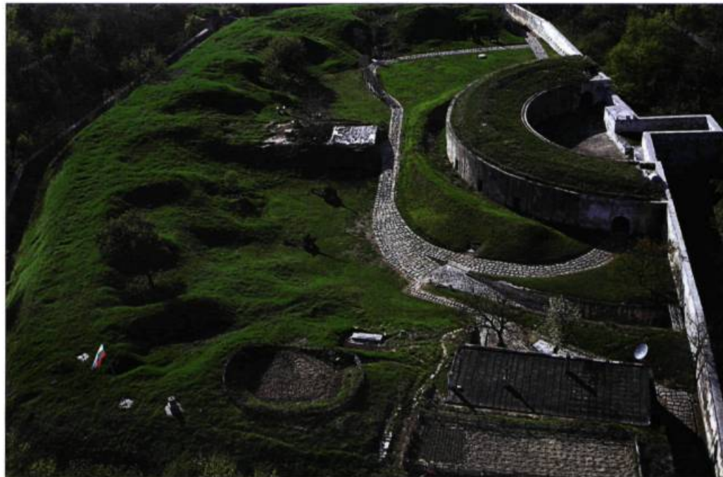
La forteresse turque Medjidi tabia a été érigée de 1841 à 1853 pour défendre la ville bulgare de Silistra, située le long du Danube, durant les guerres qui ont opposé les Turcs aux Russes.

L'EPIM a remporté deux importants prix liés au patrimoine : le Prix de la Fondation du Roi Baudouin en 1997 et la Médaille de l'Union européenne-Europa Nostra en 2008.