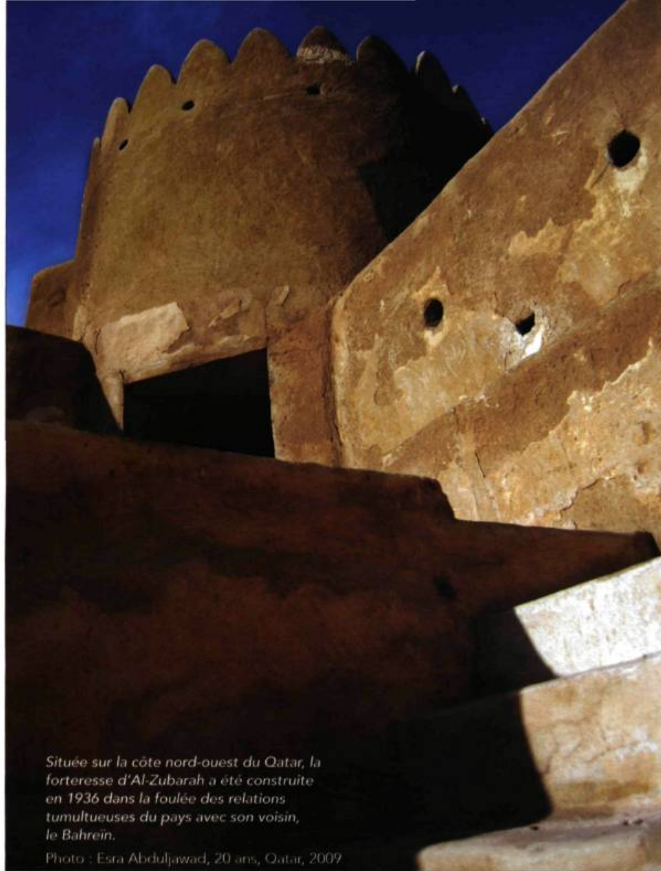
Située sur la côte nord-ouest du Qatar, la forteresse d'Al-Zubarah a été construite en 1936 dans la foulée des relations tumultueuses du pays avec son voisin, le Bahreïn.

Photo : Esra Abduljawad, 20 ans, Qatar, 2009