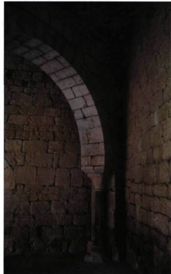
Arche du monastère de Santa Maria de Vilabertran, en Catalogne. L'ensemble monumental roman a été érigé entre le XI e et le XIV e siècle.