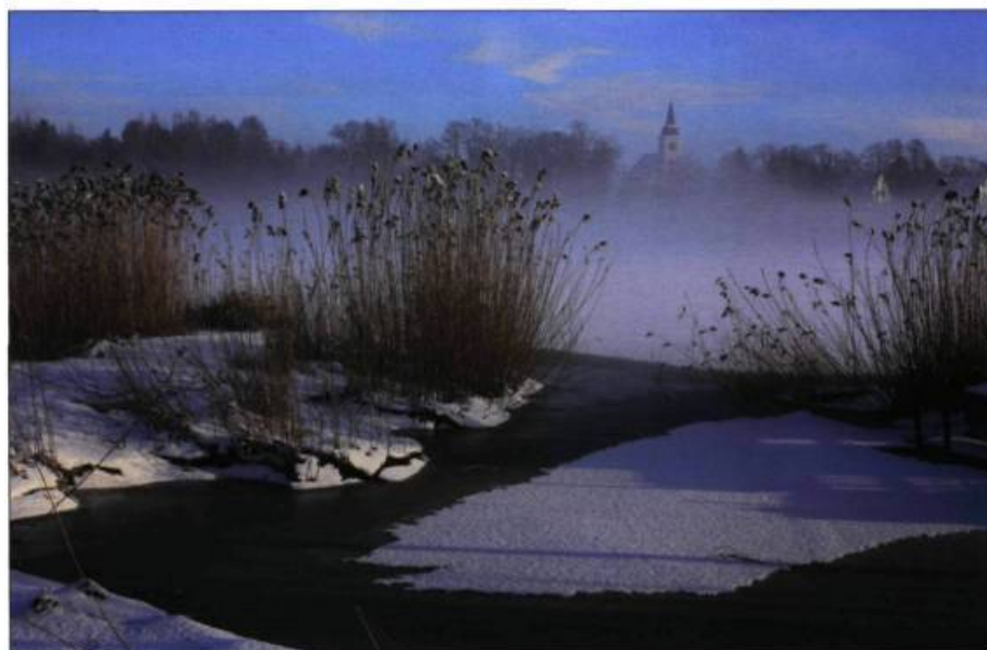
Les abords du lac de Baltezers, près de Riga, capitale de la Lettonie. En arrière-plan, on distingue l'église Ādaži, un monument classé datant de 1778.

Photo : Marija Katrina Dambe, 13 ans, 2009