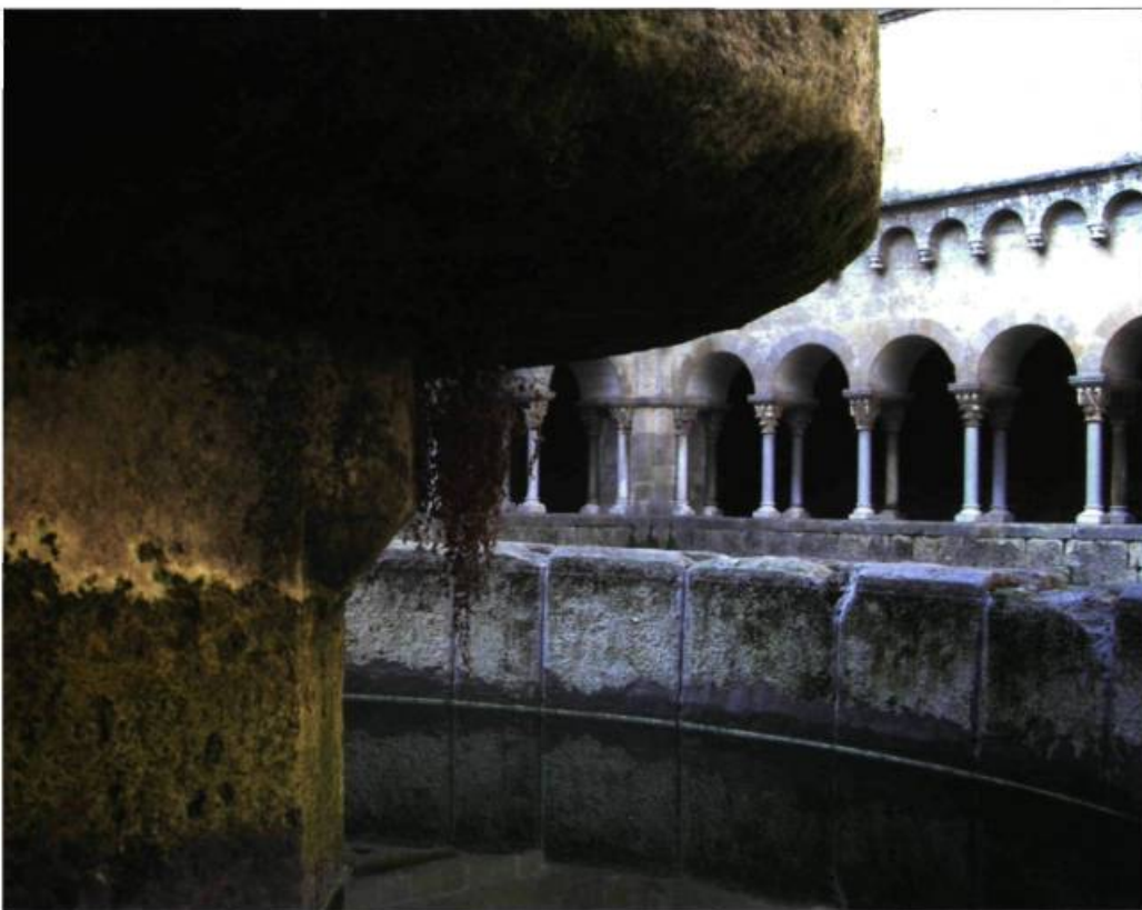
La fontaine du monastère roman de Santa Maria à Sant Cugat del Vallés, près de Barcelone