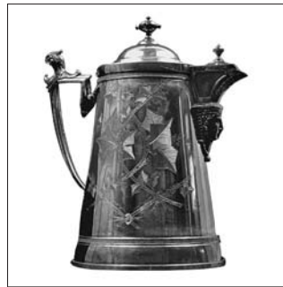
Le pichet était un élément important du buffet victorien. Celui-ci date de 1868.