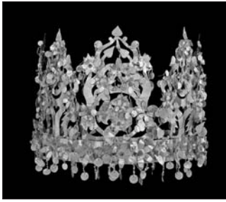
Couronne en or découverte au site de Tillia Tepe