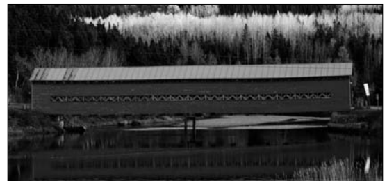
Le pont Galipeault à Grande-Vallée, en Gaspésie

Après 12 semaines à parcourir 15 000 km dans 14 régions pour prendre 6000 clichés, Manuel Mendo a mis en ligne son site sur les ponts couverts québécois. « Ponts couverts du Québec. Un autre regard » ( www.ponts.mendo-photo.com ) constitue une base photographique de tous les ponts couverts dits « authentiques » de la province et nous permet de les découvrir dans leur environnement. Ce site est également en lien avec le site et blogue « Les ponts couverts au Québec » de Pascal Conner ( www.pontscouverts.com ). Ainsi, lorsqu'on sélectionne un pont sur la carte interactive, on peut accéder tant à la galerie de photos de Mendo qu'à la fiche descriptive établie par Conner.