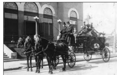
Corbillard hippomobile sur roues, années 1930.

Les pratiques funéraires au Québec des débuts de la colonie à nos jours, l'évolution des métiers qui y sont liés et les légendes qui y sont rattachées se trouvent au cœur de l'exposition « De vie à trépas », à l'affiche jusqu'au 11 mars 2012 au Musée québécois de culture populaire. Une panoplie d'artéfacts, tels qu'une table d'embaumement, un corbillard pour enfants, un habit traditionnel de croque-mort, un cercueil en béton et des bijoux faits à partir de cheveux pour honorer la mémoire du défunt, rendent compte des nombreuses transformations survenues dans le domaine. Trois-Rivières. Info: 819 372-0406 ou www.culturepop.qc.ca