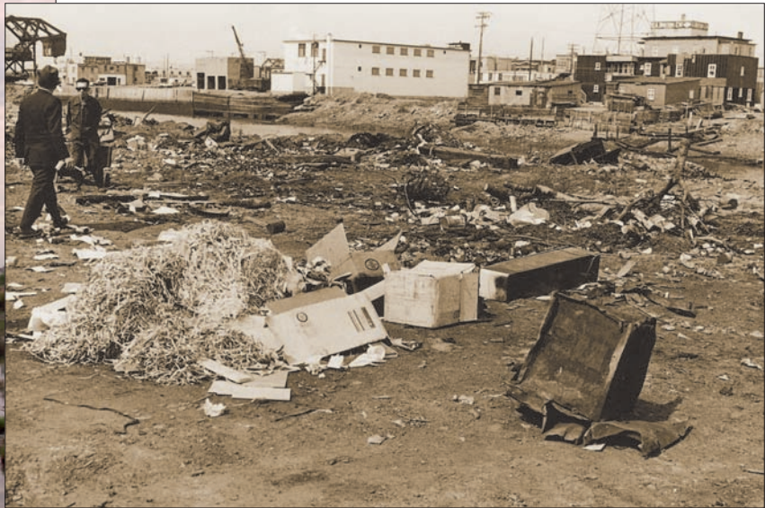
Avant les années 1970, la Saint-Charles était utilisée comme dépotoir, tel que l'illustre cette photo des berges prise près du pont Drouin par le Service de police en 1966.