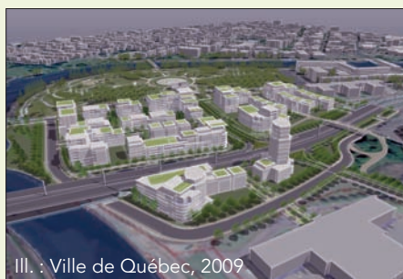
Ill. : Ville de Québec, 2009

Dans ses cartons, la Ville de Québec a comme projet de développer un éco-quartier dans le secteur Pointe-aux-Lièvres, dans Saint-Roch. Situé en bordure de la rivière Saint-Charles, ce site a été marqué par une forte activité industrielle (tannerie, incinérateur, etc.). Un écoquartier est un milieu de vie qui respecte les principes du développement durable grâce à diverses stratégies : gestion de l'eau de pluie, utilisation de matériaux durables ou recyclés, technologies assurant une bonne efficacité énergétique, espaces verts, aménagement des rues facilitant les déplacements à pied, mixité des fonctions (services de proximité, habitations, installations récréotouristiques, institutions) rendant le quartier autonome. Visant d'abord à loger les travailleurs de Saint-Roch, l'écoquartier de Pointe-aux-Lièvres offrira environ 1000 unités d'habitation et des commerces de proximité. L'aménagement d'un grand parc de huit hectares, accessible été comme hiver, sera terminé sous peu. La Ville complète actuellement la planification urbaine et a reçu des fonds du gouvernement provincial pour procéder aux travaux de décontamination de certaines parties du site. Plus de détails devraient être rendus publics au cours de l'été.