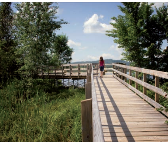
Long de 32 km, le sentier pédestre du parc linéaire longe la rivière Saint-Charles du bassin Louise jusqu'au lac Saint-Charles.