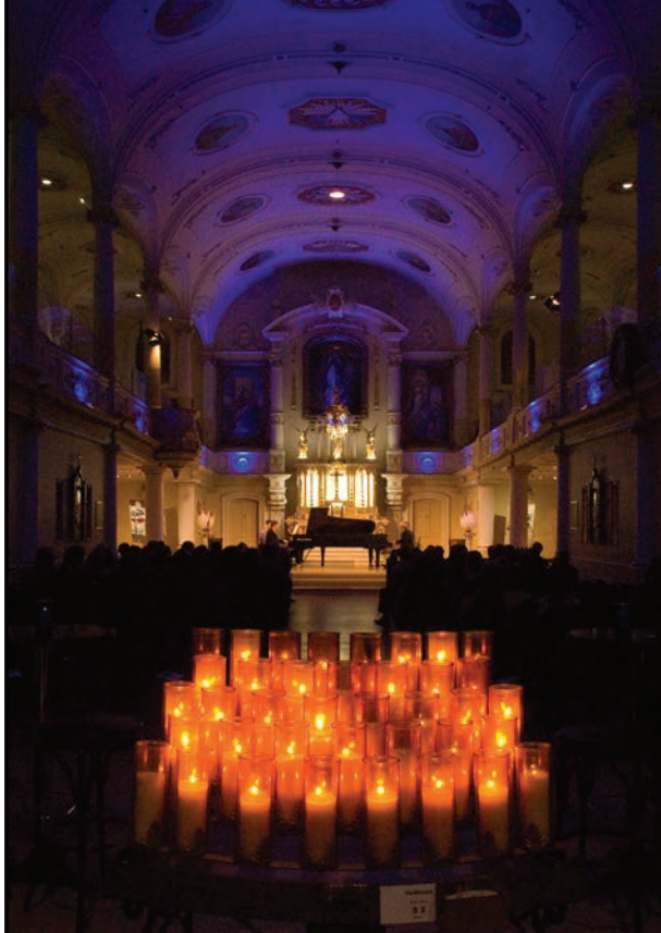
L'église Notre-Dame-de-Jacques-Cartier, dans le quartier Saint-Roch à Québec, accueille divers spectacles et activités, en plus des messes du dimanche. En septembre dernier, on inaugurerait officiellement l'Espace Hypérion, le nom donné à la salle.

Même si, par leur taille et leur organisation spatiale, les couvents se prêtent mieux que les églises à ces nouvelles fonctions, ils posent leur lot de défis. Souvent, soit les ailes de l'édifice sont trop étroites pour qu'on y aménage des unités de chaque côté d'un corridor central, soit le bâtiment est trop large pour que des unités le traversent. Une solution à ce problème serait d'implanter toutes les pièces de services (salle de bain, rangement, salle de lavage) au centre ; les espaces de vie (salon, salle à manger, cuisine, bureau) près des grandes fenêtres