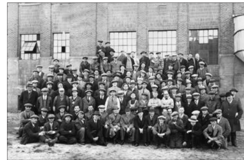
Employés et dirigeants de la brasserie Dow en 1931

À l'occasion des activités entourant son 20 e anniversaire, Pointe-à-Callière a conçu pour la première fois une exposition permanente à l'extérieur de ses murs. «Dites donc Dow! L'histoire d'une brasserie d'ici» est présentée au Carrefour d'innovation INGO, dans l'ancienne tour de brassage du complexe Dow appartenant aujourd'hui à l'École de technologie supérieure. En plus de relater l'histoire d'une entreprise qui a joué un rôle important dans la vie économique du quartier Sud-Ouest de Montréal et dans celle du Québec, l'exposition témoigne du passé industriel et brassicole de la métropole sur plus de 200 ans. Info: 514 872-9150 ou pacmusee.qc.ca