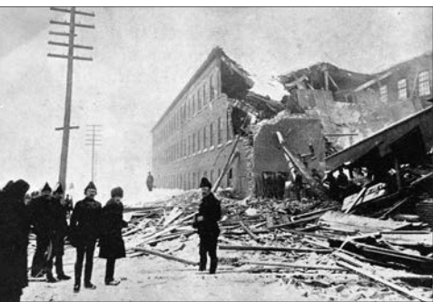
Incendie à Saint-Roch, en 1891