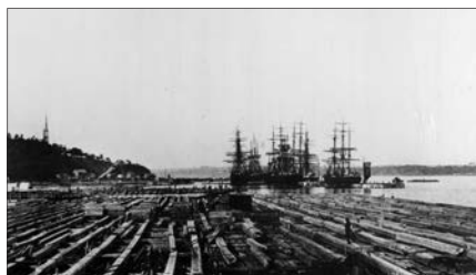
Chantier naval à Sillery au XIX e siècle