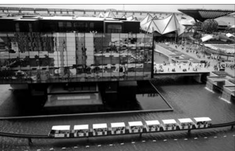
Pavillon du Québec à Expo 67 Photo: André Readman, BAnQ, E6,S7,SS1,P711102

plans, photos et dessins, dans une mise en scène du cinéaste Étienne Desrosiers. Un catalogue d'exposition, comprenant deux entrevues avec Durand et Desrosiers sur DVD, a aussi été publié aux Éditions Point du jour. Au Centre d'exposition de Repentigny, du 30 septembre au 28 octobre. Info: 450 470-2787 ou www.ville.repentigny.qc.ca/expositions