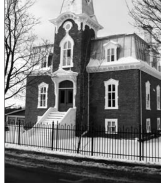
La maison Joseph-Rioux, à Trois-Pistoles