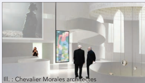
Ill. : Chevalier Morales architectes

La conception de la Maison de la littérature a fait l'objet d'un concours d'architecture, qu'ont remporté la firme Chevalier Morales architectes et le scénographe Luc Plamondon. Audacieux et ingénieux, leur projet était le seul à proposer la construction